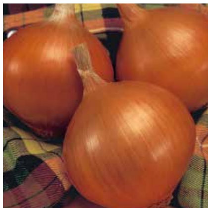
Yellow Stone F1